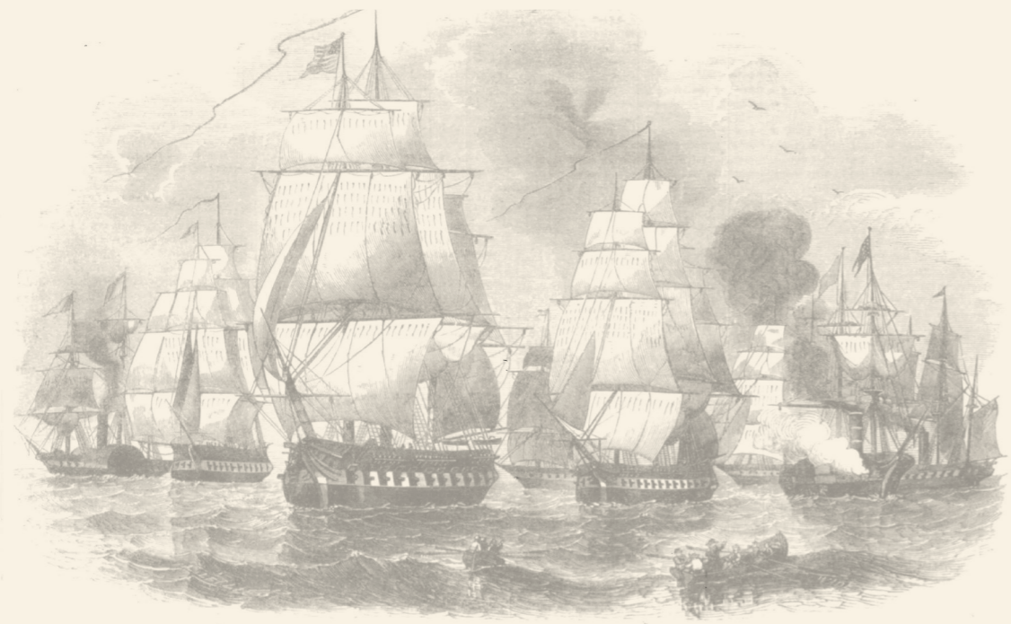
BOSQUEHANNAN. SARATOGA. ST. MARY'S. SUPPLY. PLYMOUTH. PERRY. MISSISSIPPI. PRINCETON. VIEW OF THE VESSELS COMPOSING THE JAPANESE SQUADRON.